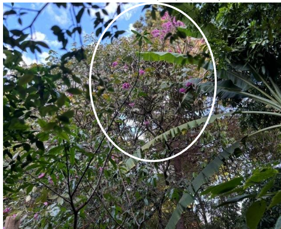
Figura 01: Ipê-rosa (Nome Científico: Handroanthus heptaphyllus )

Em vistoria à Rua das Amendoeiras, nº 82, Bairro Campestre, neste município, no dia 26 de junho de 2024, conforme solicitado no Requerimento Nº 021/2024 SISAM, foi observado que nos fundos do interior do imóvel mencionado, adjacente à cerca da mata do Clube Campestre, existe 01 (uma) árvore da espécie Ipê-rosa (Nome Científico: Handroanthus heptaphyllus ) , e uma árvore da espécie Mangueira (Nome Científico: Mangifera indica ) , para as quais a requerente solicita a poda de manutenção, em específico. Segue o registro fotográfico no momento da vistoria.